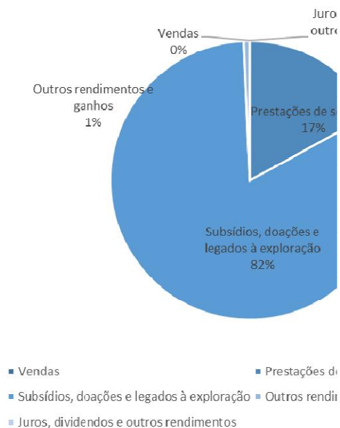
Figura 2 – Orçamento de Rendimentos

Sendo o total de rendimentos estimados de 401.550,06 euros podemos constatar pela análise dos quadros anteriores que as rubricas mais representativas são as Prestações de Serviços e os Subsídios. Estes representam 17% e 82%, respetivamente, do total de rendimentos estimados.