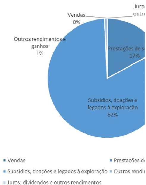
Figura 2 – Orçamento de Rendimentos

Sendo o total de rendimentos estimados de 401.550,06 euros podemos constatar pela análise dos quadros anteriores que as rubricas mais representativas são as Prestações de Serviços e os Subsídios. Estes representam 17% e 82%, respetivamente, do total de rendimentos estimados.